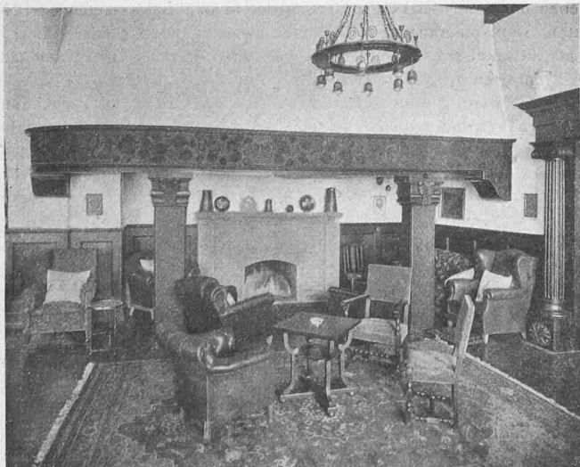
Abb. 12. Kaminplatz im Hauptraum der Halle.

Versuche im Grossen, die sich auf eine längere Reihe von Jahren zu erstrecken hätten, werden sichern Aufschluss darüber geben, ob die rostschtzenden Zementanstriche, die ja lediglich anorganische und daher an der Witterung unveränderliche Bestandteile enthalten, in gewissen Fällen sich nicht mit Vorteil zum Ersatz der bisher üblichen