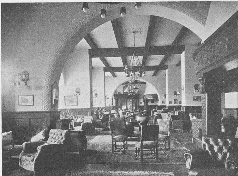
Abb. 11. Hauptraum der Halle im Hotel Suvrettahaus, gegen das Restaurant gesehen.

Durch die in den Gaswerken und Kokereien übliche Entgasung der Steinkohle bei Luftabschluss wird eine Aufspaltung des rohen Brennstoffs in die edlern Hauptprodukte Gas und Koks und die Nebenprodukte Teer, Ammoniak, Schwefelwasserstoff, Cyan usw. erreicht. Dieser Prozess, auch „Trockene Destillation“ genannt, ist nur von einem sehr kleinen Energieverlust begleitet, wie folgende