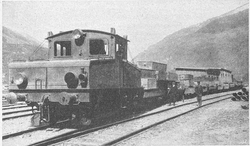
Abb. 23. Akkumulatoren-Lokomotive der A. E. G. mit Materialzug, vor der Einfahrt. Die Normalspurzüge werden tunnelseinwärts geschoben und tunnelseinwärts gezogen.

Jede Lokomotive hat zwei Akkumulatoren-Batterien; deren Kapazität beträgt bei gleichmässiger einständiger Entladung: 85 000 Wattstunden, zweistündiger „ : 106 000 „ dreistündiger „ : 124 000 „