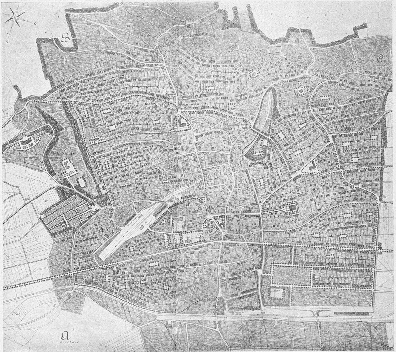
II. Preis. Entwurf „Alt und Neu“. — Verfasser: A. von Arx und W. Real, Architekten in Olten. — Masstab 1:12 000.

föhrbar. Auch die Lage des Gemeindehauses daselbst wird dadurch illusorisch. Im Uebrigen sind bemerkenswerte Vorschläge für Platzanlagen für das Dorfinnere im Projekt nicht enthalten, dagegen verdient Beachtung der zur protestantischen Kirche axial angelegte Aufgang von der römisch-katholischen Kirche her.