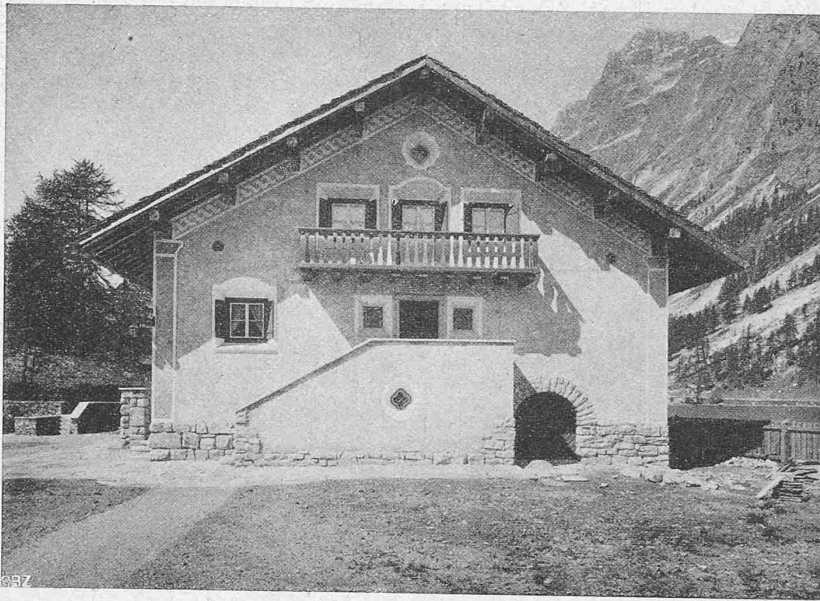
Abb. 4. Ostfront des Ferienhauses Bartuns am Silsersee, Engadin.

Der Rohbau ist ganz aus einheimischem Material aufgeführt: Fexerstein mit einigem Sgraffito für Mauerwerk