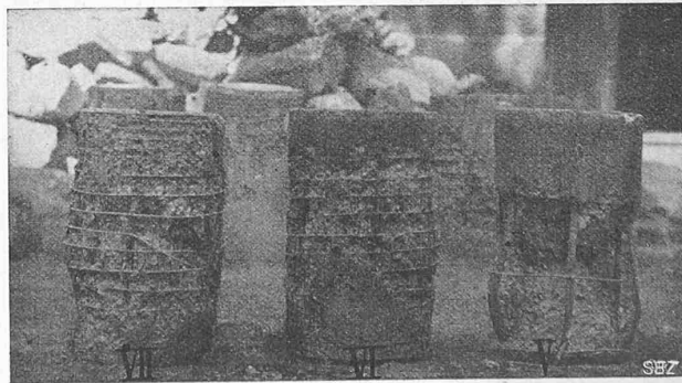
Abb. 5b. Versuchskörper V, VI und VII.

Festigkeit erhöhende Wirkung der Umschnürung setzt, wie dies bei allen wissenschaftlichen Versuchen nachgewiesen