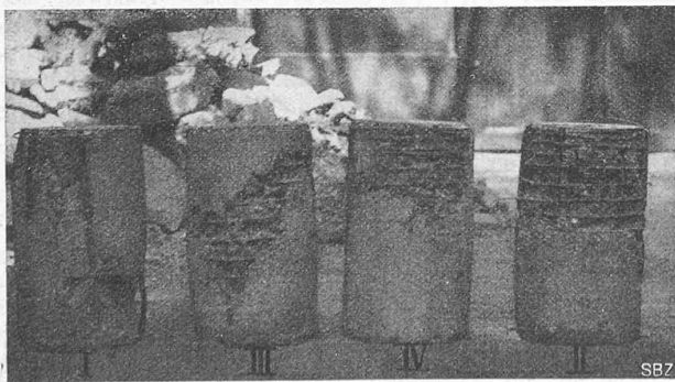
Abb. 5a. Versuchskörper I, II, III und IV.