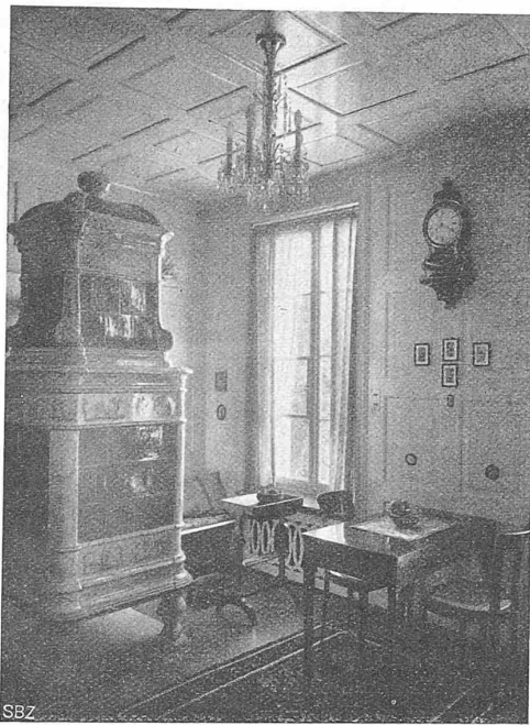
Abb. 7. Blick ins Stübli („Zimmer 1“ im Grundriss).

In Beantwortung der zweiten Frage wird Gleichstrom von 1500 V