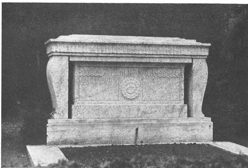
OBEN KOLUMBARIUM FÜR 84 URNEN

ARCHITEKTEN B. S. A. RITTMAYER & FURRER, WINTERTHUR