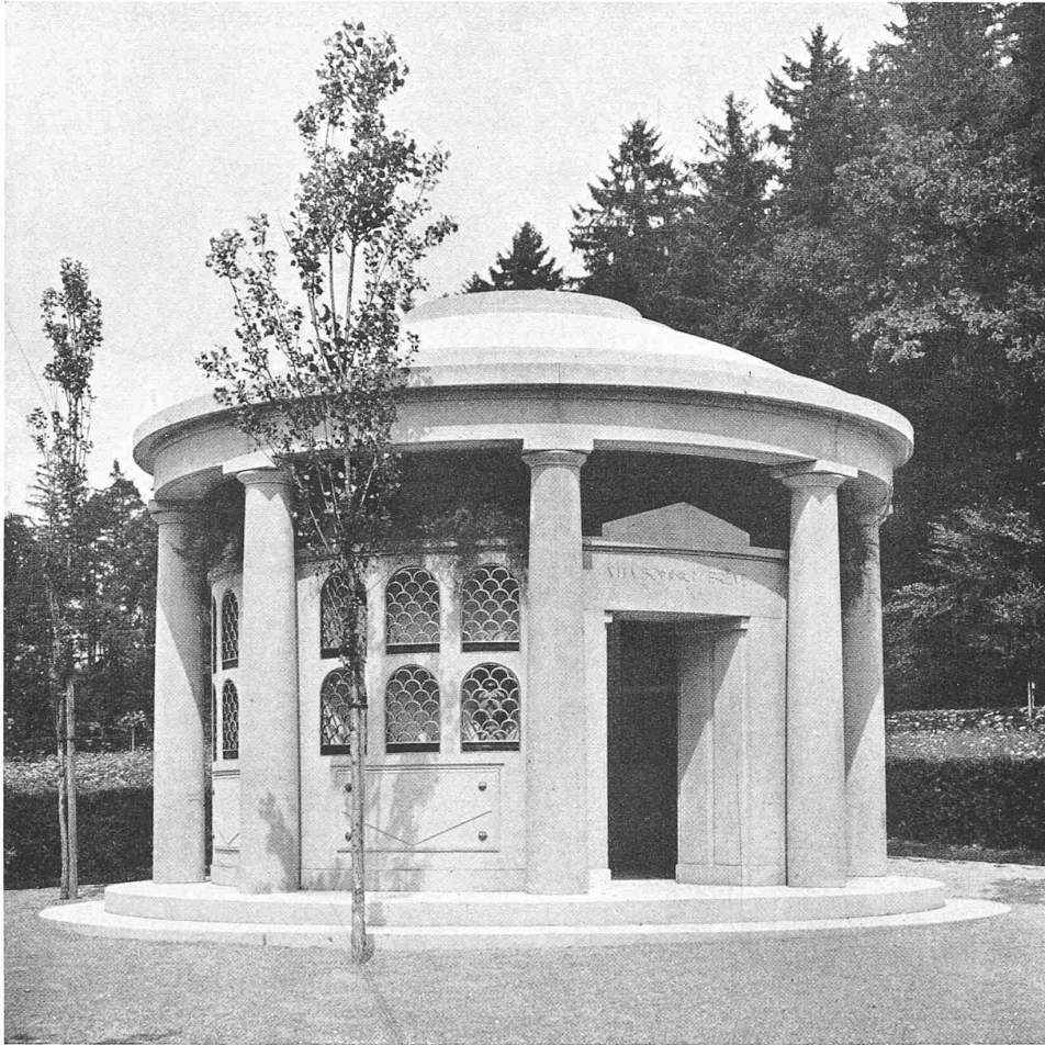
GRABMALE AUF DEM ROSENBERGFRIEDHOF IN WINTERTHUR

ARCHITEKTEN B. S. A. RITTMAYER & FURRER, WINTERTHUR