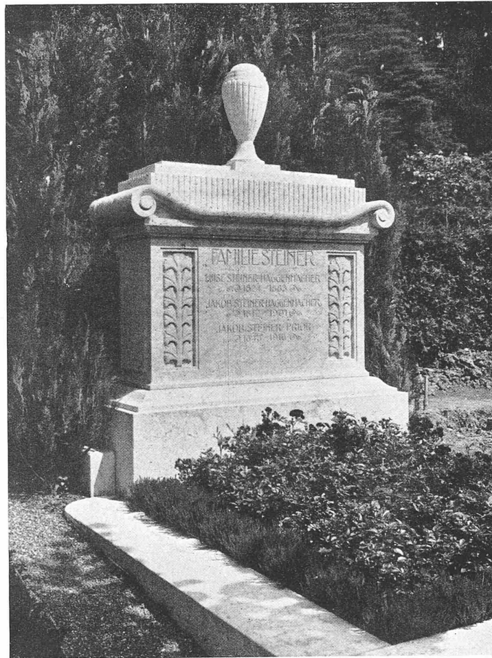
GRABMAL DER FAMILIE STEINER