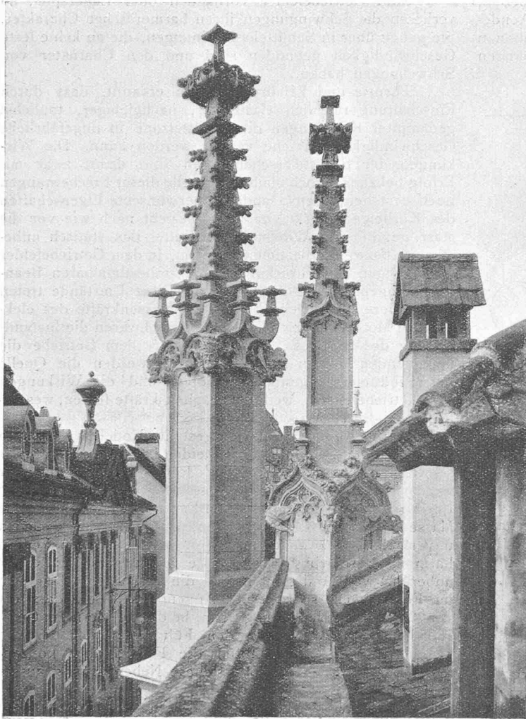
Abb. 4. Neue Fialen an der Südwestecke des Berner Münsters.

Die Störungswirkungen von Lagerspielen können durch ein Dreifedersystem mit drei um je 120^\circ verschobenen Exzentern gemildert werden, indem in diesem Fall stets mindestens zwei Federn tragen. Ein Vier- oder Sechphasensystem verbessert sinngemäss noch weiter die Gleichmässigkeit der Eingriffsverhältnisse und damit die Mittelkraft des Systems.