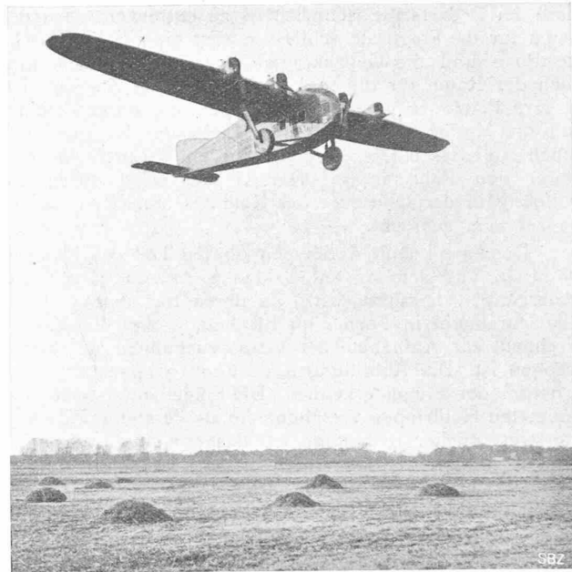
Abb. 8. Das 1000 PS-Zeppelin-Verkehrsflugzeug im Fluge.

Der Rumpf (Abbildung 9 auf Seite 309) weist im Grundriss eine sorgfältig windschnittige Form auf, im Seitenriss jene eines neuzeitlichen dicken Flügelprofils. Bei dieser Formgebung des Rumpfes ist das Streben