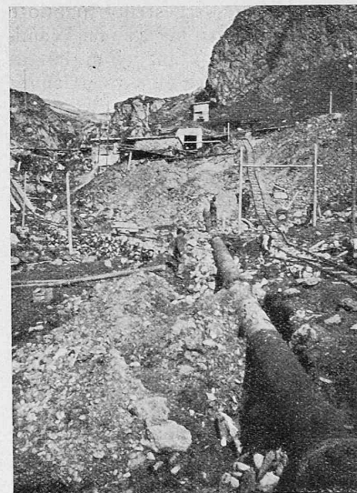
Abb. 21. Die Druckleitung Fully im Bau.

III. Il est désirable de définir et d'unifier le mode d'enregistrement et de présentation de renseignements d'ordre technique et économique concernant la traction électrique; la section propose de faire examiner cette question par une commission spéciale de l'Association internationale des Chemins de fer. Cette commission indiquerait quelles sont la nature et la définition précises des renseignements relatifs à chaque élément d'une installation de traction électrique propres à les rendre absolument comparables.“