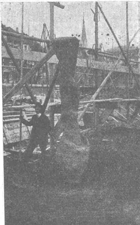
Ausgegrabener Strausspfahl in St. Gallen

DES SCHWEIZ. ING.- &amp; ARCHITEKTEN-VEREINS &amp; DER GESELLSCHAFT EHEM. STUDIERENDER DER EIDG. TECHN. HOCHSCHULE.