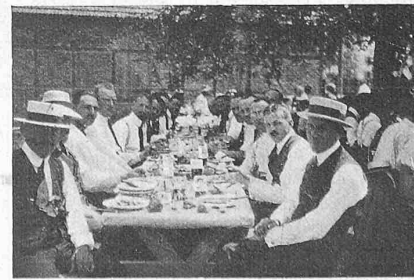
Abb. 8. Tafelfreuden.

Nur zu früh wurde es Zeit zur Heimfahrt. Es ist aber immer gut, ein Vergnügen auf dem Höhepunkt, oder doch möglichst bald nachher abzubrechen. So wars auch hier, und die Teilnehmer, die auf gegen 500 angewachsen waren, hegen sicher heute noch die beste Erinnerung an den in