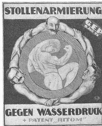
Abb. 6. Eidgen. Stollen-Triumvirat.

Ausser obigen Preissummen war jeder Teilnehmer mit 500 Fr. honoriert worden (Gesamtsumme 4000 Fr.).