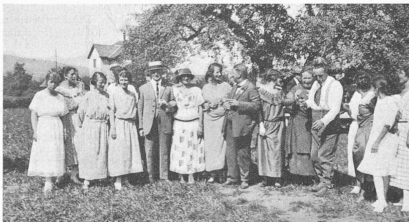
Abb. 9. Der Ex-Präsident der G. E. P. im Kreise der Damen auf dem Festplatz in Siebnen.

Ehemaligen rücksichtsvoll angepasst, gleichzeitig die einzelnen Baumschatten ausnützend. So gab es lauter kleinere Gruppen und bei jeder keinen zu grossen Lärm, der zunächst vorwiegend aus Teller-, Löffel- und Gläser-Geräuschen zu harmonischer Einheit verschmolz. Unsere Bildchen, die wir verschiedenen Kollegen verdanken (einige weitere wird das nächste G. E. P.-Bulletin bringen), geben Einzelheiten aus jenem höchst vergnüglichen Lagerleben wieder, das durch die sympatische weibliche Bedienung noch besondern Reiz gewann. Ja: besonders! Denn der Berichtstatter war stiller (im Gegensatz zu „aktiver“) Teilnehmer einer artigen Szene, die sich vermutlich auch an andern Tischen abgespielt haben wird. Ein etwas, sagen wir lyrisch veranlagter Kollege wollte durch sanftes Streicheln der ihn bedienenden Hebe offenbar seine Dankbarkeit bezeugen, wunderte sich aber, keine Gegenliebe zu finden, bis ihm sein Nachbar mit freundschaftlichem Rippenstoss bedeutete: das sind doch