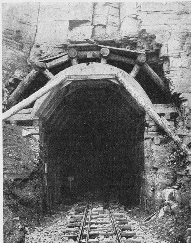
Abb. 7. Feitner-Tunnel zur Zeit der Betriebseröffnung der Fleimstalbahn.

Die typischen Lichtraum- und Mauerungsquerschnitte der Tunnel (Fleimstalbahn) sind in Abb. 9 dargestellt. Die mit 5,12 m bemessene lichte Tunnelhöhe trägt dem künftigen Ausbau auf Meterspur und elektrischen Betrieb gebührend Rechnung.