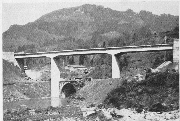
Abb. 2. Ansicht vor Füllung des Rempen-Beckens. (Unter der neuen die gewölbte Brücke der alten Strasse.)

Die Aa-Brücke Rempen eignet sich ihrer Grösse, ihrer klaren Gliederung und insbesondere ihrer Empfindlichkeit für elastische Deformationen wegen, vorzüglich als Versuchsobjekt. Die am 25. Oktober 1923 im Auftrage der A.-G. Kraftwerk Wäggitäl vom Berichtersteller geleitete