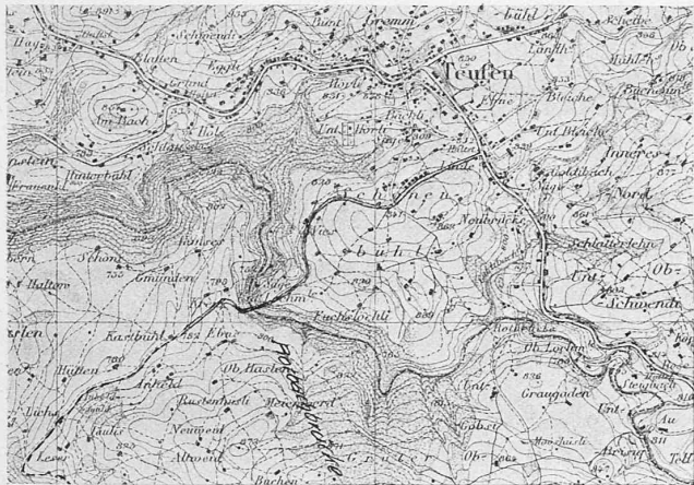
Abb. 4. Uebersichtskarte der Rotbach-Brücke. — 1 : 35 000.