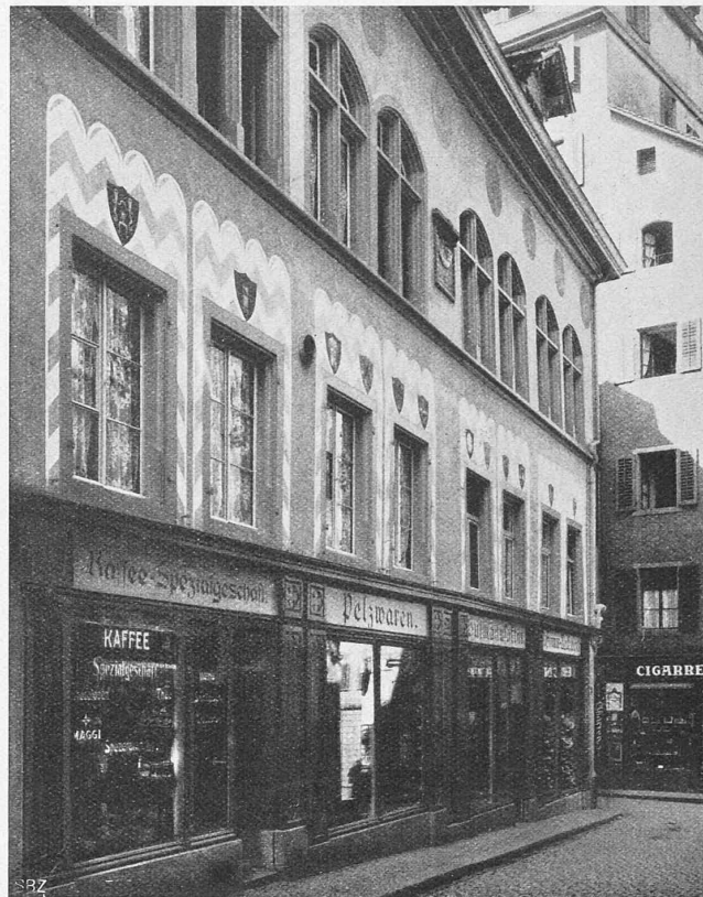
Abb. 1. Zunfthaus zur Schmieden am Rindermarkt („Schmiedstube“).

hin zerstört; vereinzelt, hart und schreiend stehen die bunten Schilder ohne jeden Zusammenhang vor dem grauen Grund; auf einer bemalten Fassade aber können sie auf den farbigen Grund Bezug nehmen, als Steigerung oder wohlhabender Gegensatz ordnen sie sich einer höheren Einheit unter, wodurch sie zugleich ruhiger und wirksamer werden. Denn nun nimmt sozusagen das ganze Haus an der Reklame teil, und diese wird zugleich ein Schmuck des Ganzen, und so ist beiden Teilen gedient: es entstehen grössere Farb-Einheiten. Reihen sich die vorerst zerstreuten farbigen Häuser einmal zu lustig bunten Strassenzügen aneinander, in den alten, oder in ganz neuen Strassen — natürlich nicht in der Bahnhofstrasse —, so wird die Farbe der Stadt gewiss klingender, aber zugleich rhythmisch grosszügiger, somit ruhiger geworden sein als jetzt. Und den Aengstlichen diene zum Trost, dass die Zeit ja auch die grellsten Farben nur zu rasch patiniert, sodass wir ihnen ein paar Jahre jugendlichen Austobens wohl gönnen dürfen: einmal stumpf geworden, wirken sie dann noch immer farbig, wenn auch von gedämpfterem Klang, während die gelblichen und grauen Töne eigentlich nicht patinieren, sondern nur schmutzig werden.