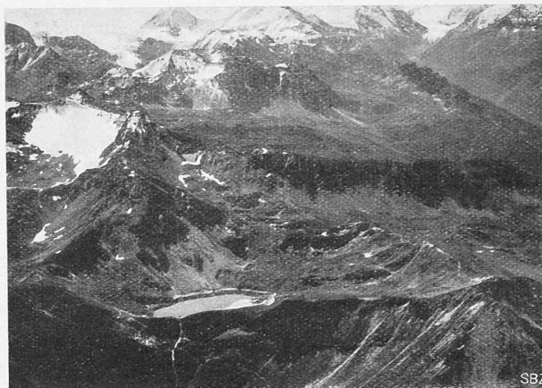
Abb. 4. Der Illsee aus Norden, ungefähr 17 m abgesenkt.

Abb. 1, 4 und 5 sind Fliegerbilder von W. Mittelholzer, „Ad Astra Aero“ in Zürich.