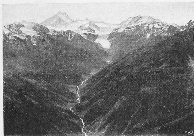
Abb. 5. Blick in den Hintergrund des Turtmanntales.