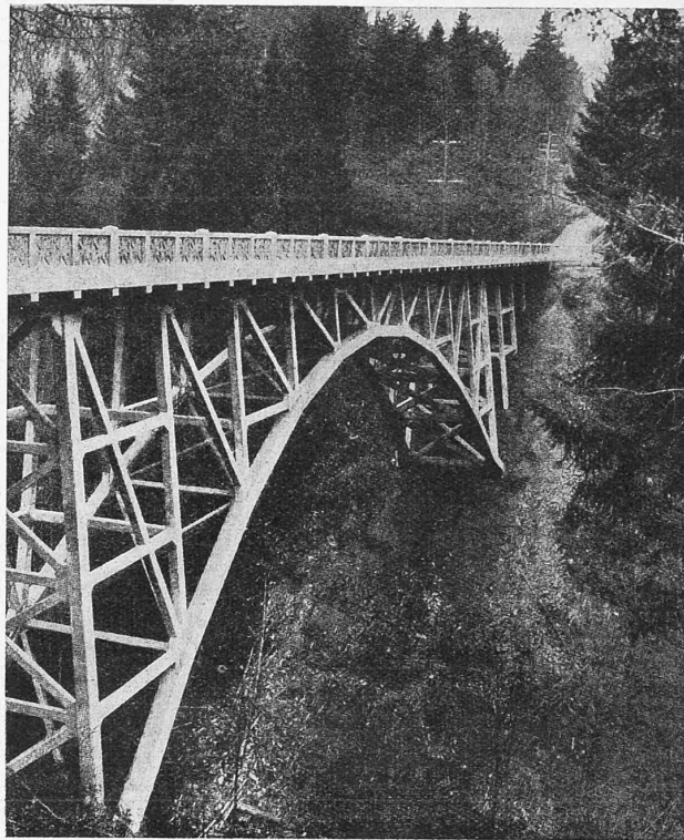
Alexander Avenue Viadukt bei Portland, Oregon.

Ün po as dumander, scha ils progress della technica sun saimper ün bain, diversas vuschs as faun sentir nel senso cuntrari, cha l'Engiadina eira pü bellas sainza vias drettas, sainza staungias e condots electricis, sainza vias d'fier, sainza ils automobils e lur puolvra, sainza ils palaces, sainza il grand trafic chi regna uossa da sted e d'inviern. Que ais güst, cha il progress maina con se divers inconveniaints, cha la natüra eira forza pü poetica avaint 100 ans, ma eau sun fermamaing persvas, ch'üngüns veritabels Engiadinais non vulessan giavüscher inavous ils temps passos. Con buna volunted as laschan schivir bgers inconveniaints del progress ed