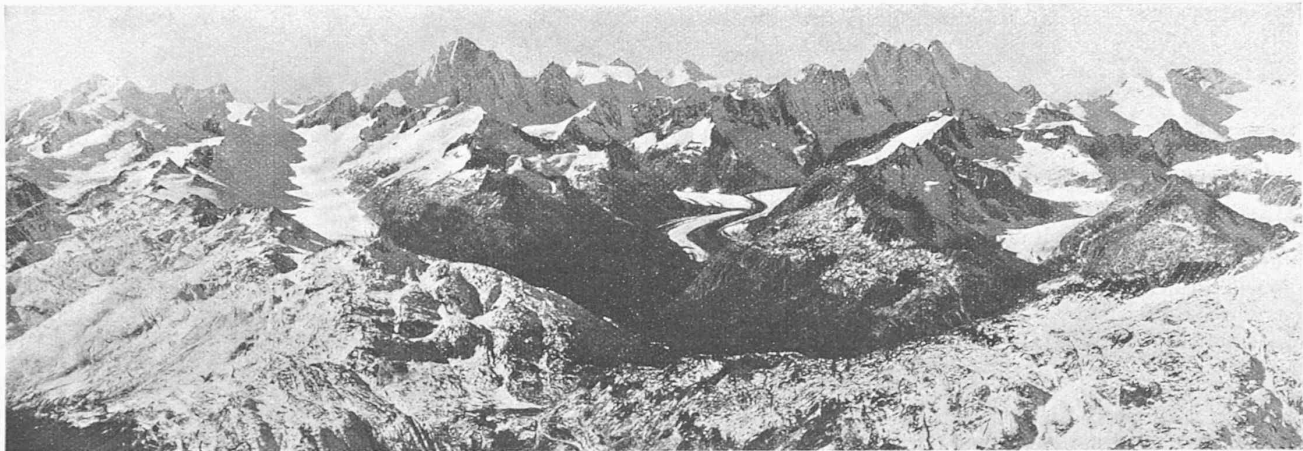
Abb. 7. Fliegeraufnahme aus Osten, aus 3800 m Höhe. — Legende: 1 Walliser Fiescherhörner, 2 Oberaarletscher, 3 Finsteraarhorn, 4 (unten) Grimselpass mit Totensee, 5 Mönch, 6 Unteraarletscher, 7 Lauteraarhorn, 8 Schreckhorn, 9 Bächligletscher, 10 Gauligletscher.