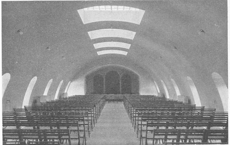
Abb. 8. Versammlungsaal im Dachgeschoss der Schweizer. Volksbank (vergl. Schnitt, Seite 123).