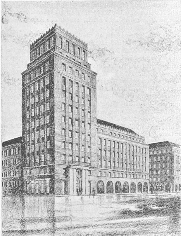
Entwurf Nr. 4. — Nordecke des neuen Bahnhofplatzes.