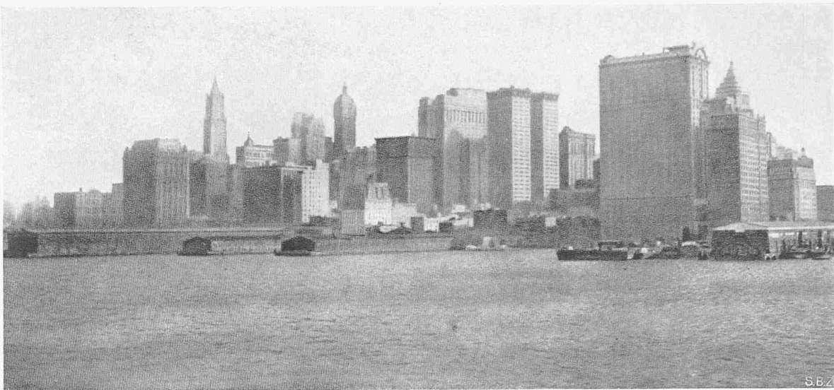
NEW YORK / HAFENEINFAHRT

AUS: AMERIKA, BILDERBUCH EINES ARCHITEKTEN. VON ERICH MENDELSON BUCHVERLAG RUD. MOSSE, BERLIN