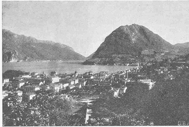
Abb. 1. Lugano-Paradiso mit dem Monte San Salvatore.

Die erste und wichtigste Frage für den Umbau bestand darin, ob das vorhandene Oberbaumaterial ohne die Zahnstangen für eine wesentlich leistungsfähigere Bahn beibehalten werden konnte, was anfänglich mit Rücksicht auf die sehr niedrigen und leichten Schienen, an denen zukünftig die Wagenbremsen wirken sollten, sowie wegen