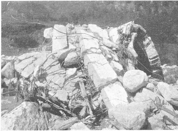
Abb. 5. Die „aufgerollte“ rechtsufrige Brückenhälfte.