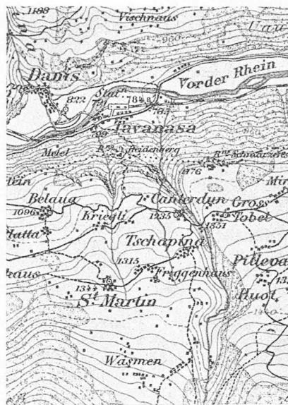
Abb. 1. Karten-Ausschnitt von Tavanasa. Masstab 1:40000. Höhenkurven 30 m.

Bemerkenswert aber, im Hinblick auf die Widerstandsfähigkeit der gewählten Eisenbetonkonstruktion, ist der gegenwärtige Zustand der Brückentrümmer. Während die rechtsufrige, von den stürzenden