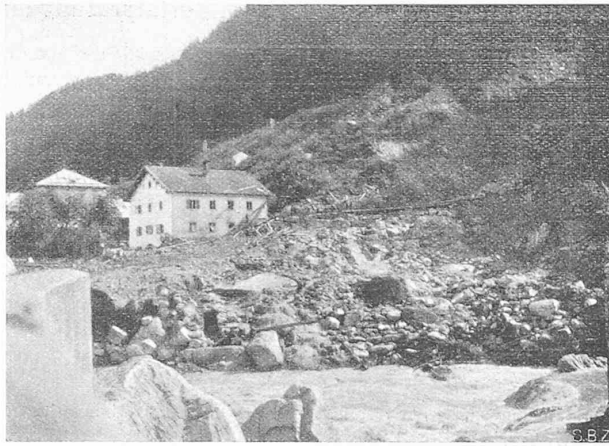
Abb. 2. Blick vom linken Widerlager gegen Tavanasa, rechts das durch die Rufe ausgefegte Tälchen des St. Martin-Baches.