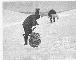
Abb. 3. Bergung einer Kiste und Zusammenlegen des Fallschirms.

Bebauung des Heimplatzes in Zürich. Die ehem. v. Meiss-Liegenschaft zwischen Krautgartengasse und Heimstrasse (gegenüber dem Pfauen) ist von einer Genossenschaft erworben worden, die letzter Tage ein Baugespann für ein Geschäftshaus darauf errichtet hat. Da die bauliche Nachbarschaft des Kunsthauses natürlich nicht dem Zufall überlassen werden darf, haben wir uns zuständigen Ortes nach dem Sachverhalt erkundigt, und dabei erfahren, dass diesbezüglich keine