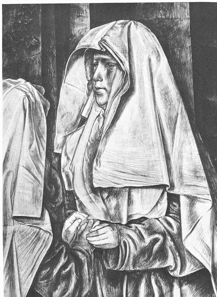
FRESKEN IM FRAUMÜNSTER-DURCHGANG ZÜRICH