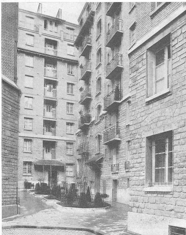
Abb. 4. Von der Pariser Wohnungs-Fürsorge; Rue Rousselle, Hofansicht.