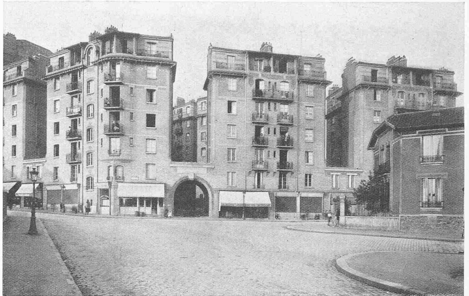
Abb. 1. Von der Pariser Wohnungs-Fürsorge; Häuser in der Rue Rousselle.

Kontrolleinrichtungen für die Notbeleuchtung und für die Saalbeleuchtung gewährleisten einen einwandfreien und sichern Betrieb, und die elektrische Betätigung des Vorhanges von verschiedenen Stellen aus vereinfacht die Abwicklung des Programmes.