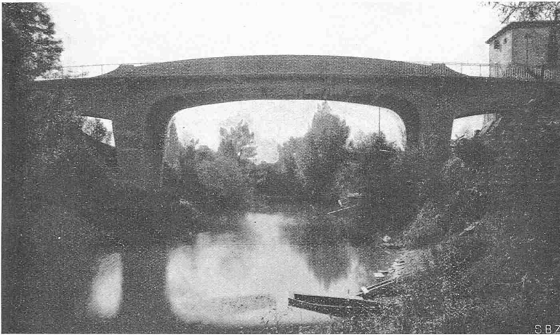
Fig. 1. Le nouveau pont-route de Labarthe sur le Drot (Gironde).