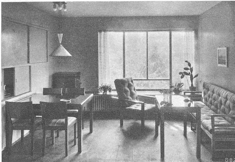
Abb. 12. Wohn- und Essraum im Hause Nr. 27. — Arch. Rich. Hächler, S. W. B., Lenzburg.