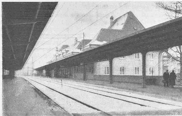
Abb. 2. Der neue Bahnhof Freiburg, Bahnseite.

Umwälzungen wird die Erfindung besonders in der pharmazeutischen, kosmetischen und in der Süsswarenindustrie hervorrufen. Mit einer Alkoholverfestigungsanlage ausgerüstete Fabriken werden nunmehr den Alkohol sicherer und billiger in Kisten verschicken können.