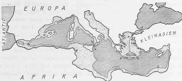
Karte des auf Kote -1000 abgesenkten Mittelmeeres.