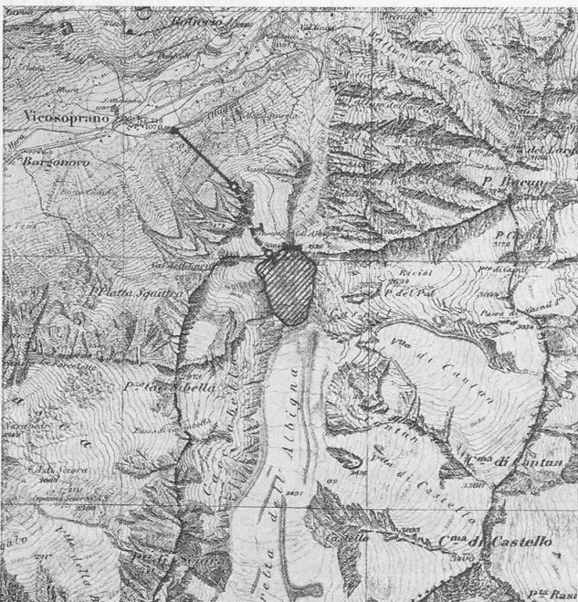
Abb. 1. Uebersichtskarte des projektierten Albigna-Kraftwerkes; Masstab 1: 75 000. Mit Bewilligung der Eidg. Landestopographie. 20. III. 1924.