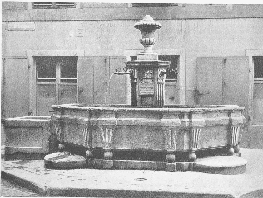
Abb. 11. Brunnen in der St. Urbangasse, Solothurn. Um 1792.

Herausgegeben vom Schweiz. Ingenieur- und Architekten-Verein. — Orell Füssli Verlag, Zürich und Leipzig.