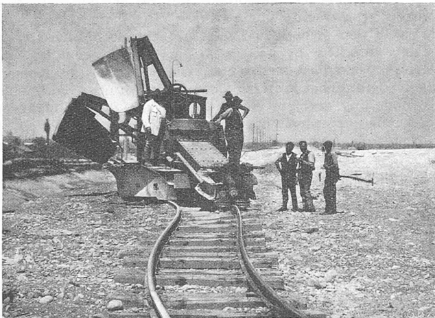
Abb. 16. Obige Maschine als Geleiserückmaschine arbeitend.

Lugano ergaben in der Luft sofort nach dem Einschlag Feldstärken zwischen 10 und 100 kV und Feldstärkenänderungen von 100 kV/m innerhalb \frac{1}{10} sec. Die Blitzstromstärken wurden in der Grössenordnung von 50 000 A gemessen. Bei derartigen Blitzschlägen in die Freileitung sind Ueberschläge der Isolatoren kaum zu vermeiden. Die starke Dämpfung der hohen Blitzspannung längs der Leitung macht aber entferntere Blitzschläge für die Stationen ziemlich ungefährlich, und es kann ausserdem ihre Wirkung durch die Vorlagerung einer Leitungstrecke mit verminderter Isolation noch weiter herabgesetzt werden. In der nachfolgenden Diskussion gingen die Meinungen über die Zweckmässigkeit dieser Anordnung noch auseinander. Schirmringe an den Leitungsisolatoren zur Erzielung einer gleichmässigen Spannungsverteilung und damit zum Schutz gegen Erdschluss-Lichtbogen haben sich allgemein durchgesetzt.