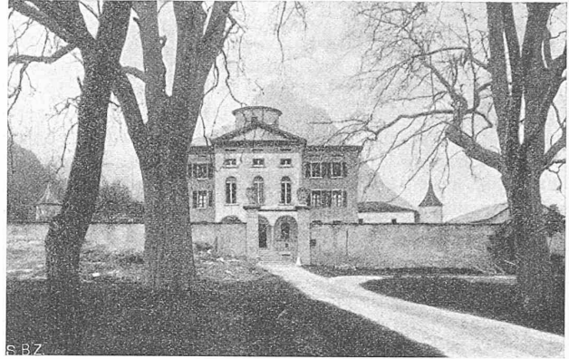
Das St. Josephsheim bei Leuk in seinem jetzigen Zustand. (Wiederholt aus „S. B. Z.“ Band 92, Nr. 21.)