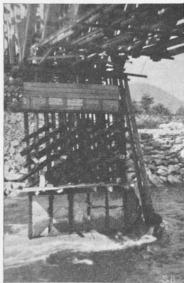
Abb. 1. Die planwidrige Pendelstütze, kurz vor dem Einsturz, den statt der vorgesehenen Ausbetonierung nachträglich aufgeklebte (!) Diagonalen noch hätten aufhalten sollen.

Die Maggia ist einer der wildesten Flüsse der Schweiz. In wenigen Stunden kann ihr Wasserspiegel trotz der sehr grossen Breite des Flussbettes auf den Stand des höchsten Hochwassers steigen.