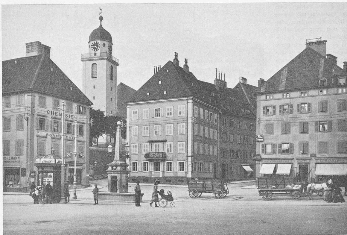
Place de l'Hôtel de Ville à La Chaux-de-Fonds, gegen Nordost, links hinten die (ovale) Stadtkirche.

stellung Aufschluss, von der 60 Millionen Fr. Bundesbeitrag für die Beschleunigung der Elektrifikation abzuziehen sind.