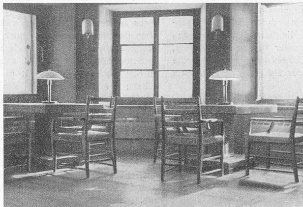
Abb. 12. Bibliothek im IV. Geschoss des Turmes.