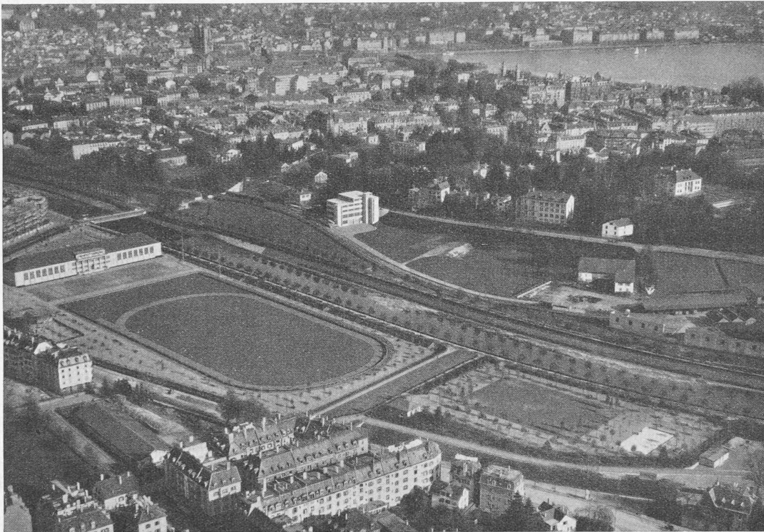
Abb. 1. „Ad Astra-Aero“-Fliegerbild aus Westen auf die neuen Sport- und Grünanlagen „Sihlhölzli“ in Zürich. Links Turnhallengebäude (jenseits der Sihl das „Eglisana“-Lagerhaus, vergl. „S. B. Z.“ 28. Nov. 1931), rechts Kinderspielplatz.