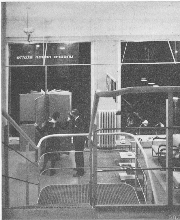
Abb. 5. Drehgestell für Stoffmuster.

Bezüglich der Betriebsicherheit steht der Tropfkörper über dem Belebtschlammverfahren, da er gegen äussere Einflüsse viel weniger empfindlich ist.