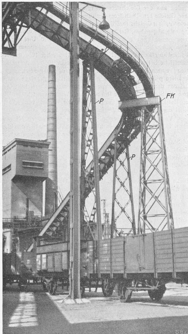
Abb. 12. Blick in den gekrümmten Teil der Koks-Förderbrücke. FK feste Stütze mit Konsolle zur Lagerung der gekrümmten Brücke. P Pendelstützen an den Enden der gekrümmten Brücke.

Luzern 68538 t, Solothurn 57596 t, Baselland 36310 t, Neuenburg 31849 t, Wallis 28641 t, Graubünden 23438 t, Freiburg 22635 t, Schwyz 18596 t, Genf 16789 t, Glarus 14745 t, Zug 10054 t, Schaffhausen 8653 t, Tessin 7881 t, Uri 5891 t, Appenzell A.-Rh. 3541 t, Obwalden 1659 t, Appenzell I.-Rh. 394 t, Nidwalden 269 t, zusammen 1326534 t. Der Rest des Verkehrs entfällt auf das Ausland, d. h. auf Transit und das badische Hochrheinufer.