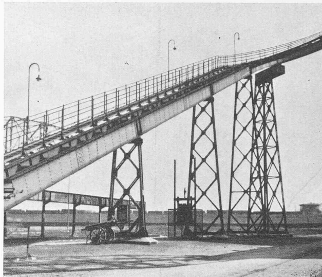
Abb. 11. Ansicht der Koksförderbrücke im Gaswerk Basel von unten.

Wenden wir uns nun noch kurz der zweiten Brücke zu, die dem Kokstransport dient, so ist zu bemerken, dass hier die Verhältnisse etwas schwieriger lagen. Der Höhenunterschied, der bei dieser Brücke überwunden wird, beträgt rund 24,4 m und die Steigung in der Brückenaxe ist rund 1 : 2,5. Die Abb. 11 gibt als Ergänzung der Abb. 2 einen guten Ueberblick über die Anordnung der Brücke. Auch hier haben wir es mit einem Zug von vollwandigen Brückenhauptträgern von konstanter Höhe zu tun. Die Ausnehmungen im Stegblech der gekrümmten Träger sind wegen der Anordnung von Seilumlenkrollen erforderlich geworden. Die Pendelstützen haben, um kleine Auflagerreaktionen, bezw. genügende Standsicherheit zu ergeben, einen Anzug erhalten. Besondere Schwierigkeiten machte auch die Anordnung der festen räumlichen Stütze; die Geleise zu ebener Erde erforderten ein starkes Heraussetzen aus der Brückenlängsaxe. An Stelle des oberen räumlichen Stabwerkes, wie wir es bei der ersten Brücke bei der Stütze 3 gesehen haben, wurde hier ein steifes vollwandiges Tragwerk am Kopf der räumlichen Fachwerk-Stütze vorgesehen. Die Vollständigkeit war bedingt aus der Forderung einer besonders grossen Biege- und Torsionsfestigkeit. Die Anordnung der Brücke, ihre Berechnung und die