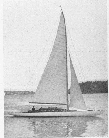
Abb. 3 und 4. Deckaufsicht und „Yg“ in Fahrt am Wind.

führung von vier weiteren Spanten veranlasste. Im übrigen hat sich ergeben, dass die Dimensionen reichlich bemessen waren und eine Reduktion erlauben.