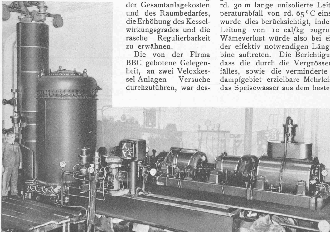
Abb. 1. Veloxkessel-Versuchsanlage in der Fabrik von Brown, Boveri & Cie. in Baden.

Die von der Firma BBC gebotene Gelegenheit, an zwei Veloxkessel-Anlagen Versuche durchzuführen, war des-