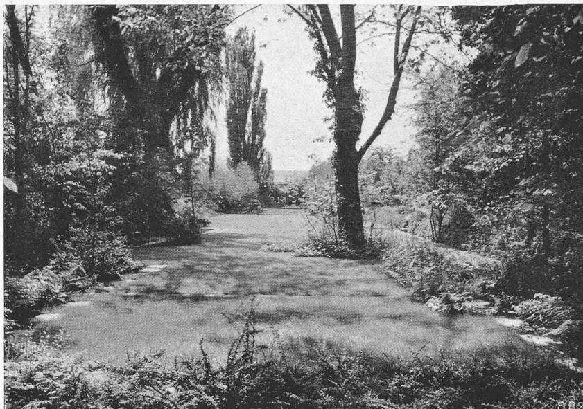
Abb. 36. Sondergarten Mertens in seiner Axe gegen Süden gesehen.

und Wärme geben. Die mit dem wiedererwachten Sinn für die Eigenschönheit der Pflanze zusammenhängende Vorliebe für die Stauden hat auch das pflanzliche Bild unserer Gärten verändert. Die Stauden haben nicht nur den Vorzug, die alljährlichen Neupflanzungen zu erübrigen, sondern sie geben uns auch die Möglichkeit, die Gesetze der Pflanzengemeinschaft im Garten weitgehend zu verwerten. Diese aufeinander abgestimmten Pflanzengemeinschaften ersparen uns in hohem Masse die dauernde Pflege durch Hacken, Jäten und Giessen, weil die Bodenbedeckung aus den sogenannten polster- und rasenbildenden Stauden eine Verkrustung und Austrocknung des Bodens verhindert“.