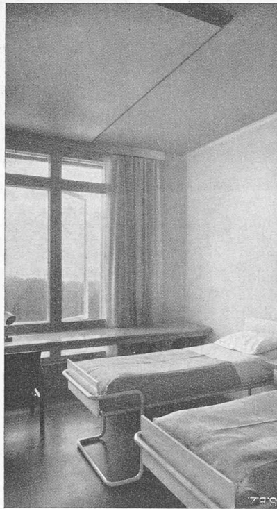
Abb. 9. u. 10. Tuberkulose-Sanatorium Paimiona in Finnland, Arch. Alvar Aalto. — Krankenzimmer mit an der Decke sichtbar montierter Paneelheizung (entgegen der üblichen unsichtbaren Ausführung).