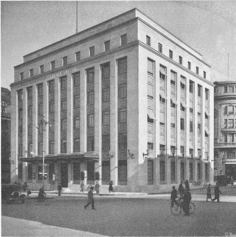
Abb. 1. Gesamtbild des Baues von der Place Bel Air aus.