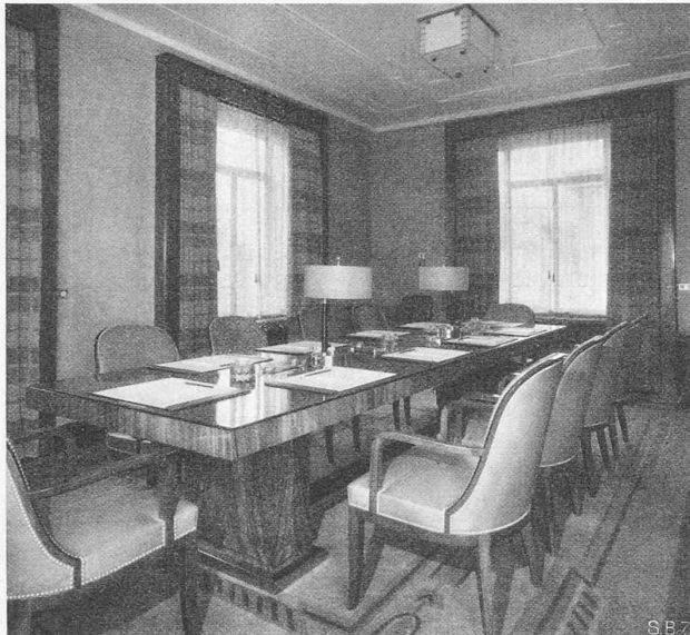
Abb. 3. Sitzungszimmer.