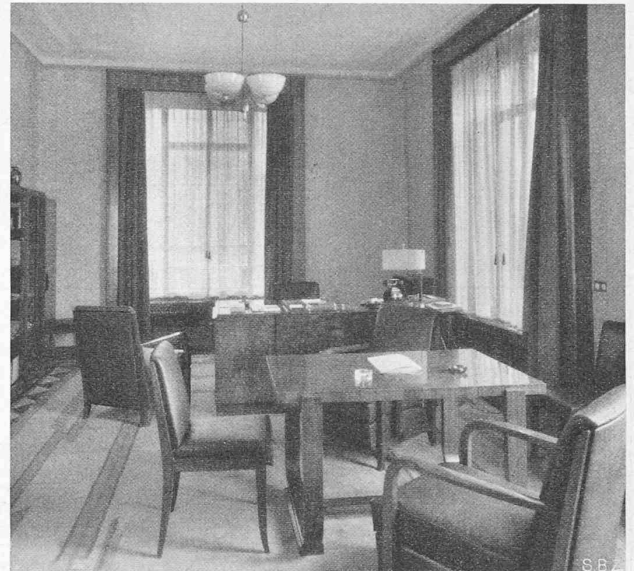
Abb. 4. Direktionsbureau.