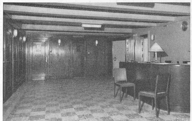
Abb. 7. Kabinen-Vorraum der Kunden-Safes im Untergeschoss.

Es ist anzunehmen, dass sich die Produktionskosten von Oel aus Kohle mit Hilfe von Schwelung allmählich