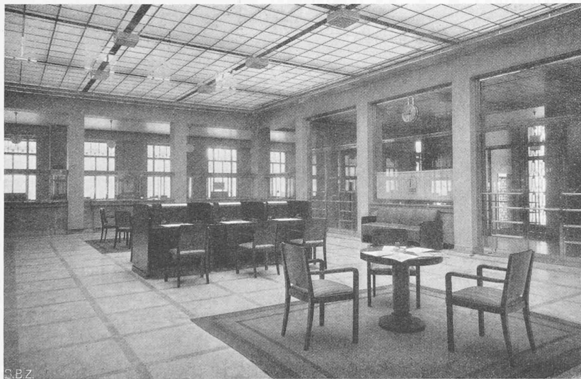
Abb. 2 (unten). Schalterhalle.