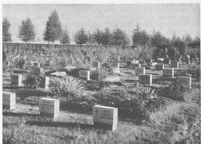
Abb. 8. Neuer Waldfriedhof („Notfriedhof“) bei Stuttgart.