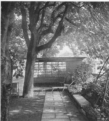
Abb. 6. Kastanienplatz und Gartenhäuschen.