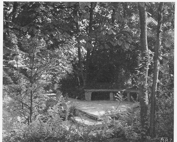
Abb. 3. Sitznische mit Steinbank unter altem Gehölz.

BILDER AUS DEM „ZÜGA“-GARTEN DER GEBR. MERTENS