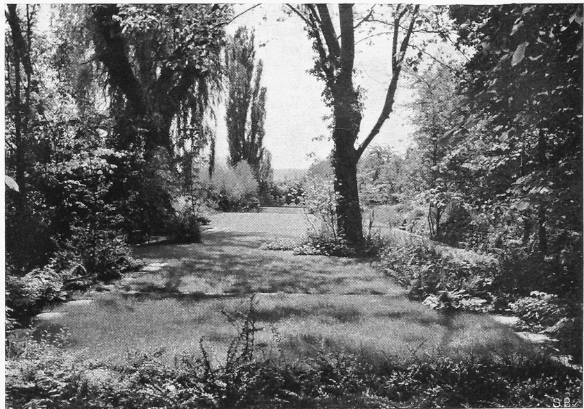
Abb. 5. Blick vom Kastanienplatz über Schatten- und Licht-Partien.

Nicht jede Plastik hält dem Himmel, der Erde und den Bäumen stand. Die Skulpturen von J. Probst waren wie geschaffen, um das Leben dieser Gartenräume in prägnanten Akzenten einzufangen und wieder auszustrahlen. Durch „das schreitende Mädchen“ wurde der Kastanienschattenplatz zum feierlichen Dom, das alte Motiv der „Susanna“ wurde neben dem Wasserbassin zu neuem Ereignis, das „Füllen von Pregny“ gab dem Spielrasen freudigen Bewegungs-Impuls, und die „singenden Mädchen“ brachten Schwung in die sonnige Sommergartenluft.