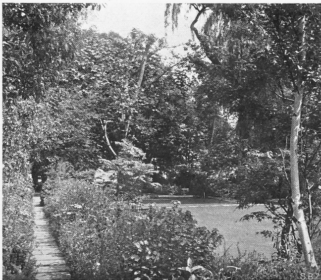
Abb. 2. Plattenweg zwischen Sommerflor-Rabatten im sonnigen Gartenteil.

Die schwingenden Formen der alten Parkbäume wurden zum sprechenden Bild vor ziehenden Wolken am blauen Himmel. Der Unkrautboden reinigte und vertiefte sich — ein feiner Rasen wuchs aus ihm, einladend zum heiteren Spiel —, die hängenden Zweige einer Trauerweide verlangten ein Wasserbassin, und auf der andern Seite straffte sich ein Graben zu einem kleinen Kanal, in dessen stillem Wasser sich die bescheidene Schatten-Vegetation des Waldbodens spiegelte (Abb. 7).