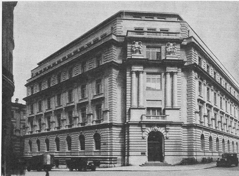
Abb. 2. Das Gebäude nach dem Aufbau (1933) der zerstörten Obergeschosse.